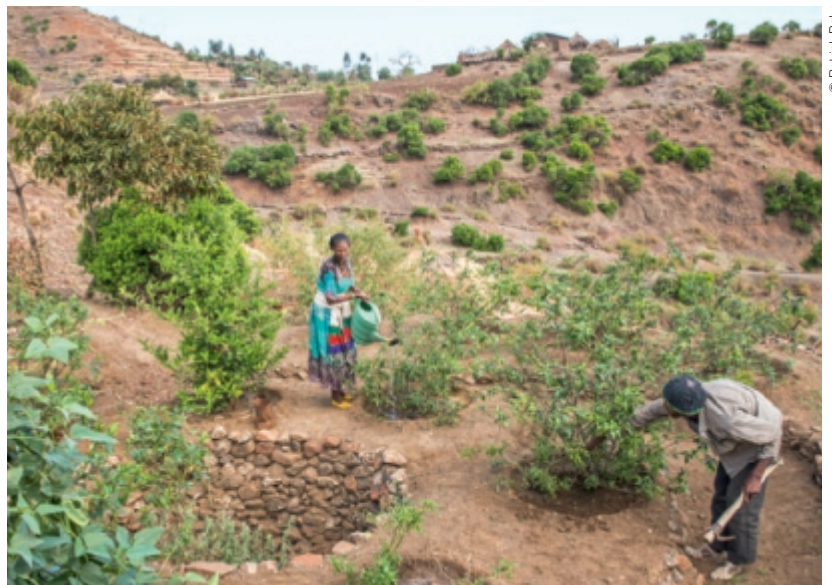
Ein Garten mitten in der trockensten Gegend Äthiopiens. Zusammen mit Helvetas sichern Bäuerinnen und Bauern mit nachhaltiger Landwirtschaft ihre Ernährung.