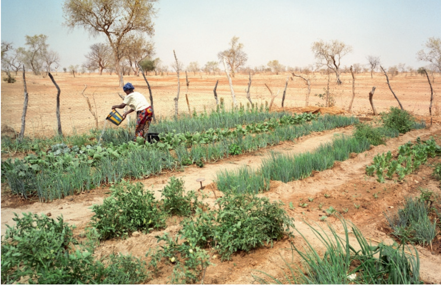
Der Klimawandel verlangt von Frauen immer mehr Geduld, um der Wüste Gemüse abzutrotzen. Aber der Aufwand sichert die Ernährung der ganzen Familie.