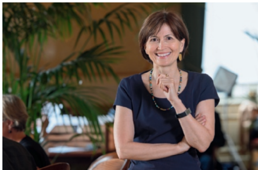
Alt Nationalrätin Regula Rytz will ihr Netzwerk künftig für Helvetas nutzen.